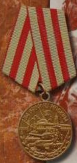
Медаль «За оборону Москвы»

Медалью «За оборону Москвы», учрежденной в мае 1944 года, награждались военнослужащие и простые москвичи, принимавшие участие в обороне столицы. Медаль также вручалась партизанам Московской области и защитникам города-героя Тулы.