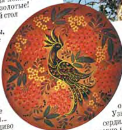
А. Бусова Декоративная тарелка

Как же появилось это диво дивное — «золотая хохлома»? Старинное предание рассказывает: жил когда-то в нижегородских лесах, на берегу тихой