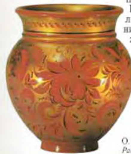
О. Лушина Расписной горшок

Ах как вкусно есть из такой сказочной посуды! Да еще золотистой расписной ложкой. Не боится хохлома ни жара, ни стужи. Все так же будут сиять ее краски, не потускнеет «золото». Потому что сделали это чудо золотые руки мастеров.