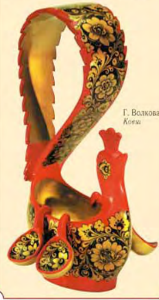
Г. Волкова Ковш

Хохломская роспись отличается характерным сочетанием золотого цвета с черным, красным, зеленым, иногда коричневым и оранжевым. Изображение растений, ягод, плодов, птиц и рыб образуют прихотливый узорный орнамент. Секрет «золота» Хохломы — применение алюминиевого (ранее серебряного или оловянного) покрытия, сверху наносится рисунок и лак. Изделие высушивается при температуре 100–120°. Под действием температуры лак приобретает желтоватый оттенок, и оловянь него «золотом» сверкает алюминиевый слой. Современные хохломские изделия — посуду, мебель, сувениры — создают мастера фабрики «Хохломской художня» (г. Семно) и объединения «Хохломская роспись» (г. Семно), что в Нижегородской области.