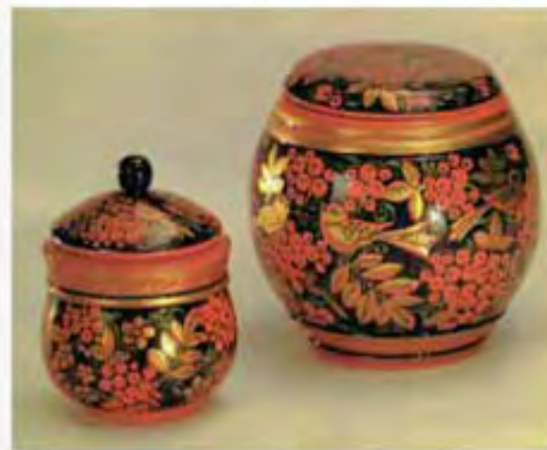
Е. Мосина. Хохломская посуда

А сделать настоящую хохлому совсем не просто. Сначала мастер вырезает из дерева заготовку — будущую чашу. Потом сушит ее и покрывает тонким слоем глины. Похожа теперь чаша на глиняную, что гончары