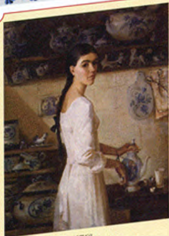
М. Вишняк. Керамистка

Гжель — один из самых известных народных художественных промыслов России. Гжельский промысел объединяет два десятка подмосковных сел и деревень. Уже с XIV века в этой местности процветал гонимый промысел. С середины XVIII века гжельские мастера освоили производство майолики с многоцветной росписью по белому фону. Роспись часто дополнялась скульптурными изображениями людей, животных, птиц. В XIX веке Гжель прославилась своим фарфором и фарфоровым. С этого времени преобладают роспись синим кобальтом по белому. Разнообразные изделия с «фирменным» цветочным узором, скульптуры поражают фантазией и мастерством художников, сохранивших народные традиции.